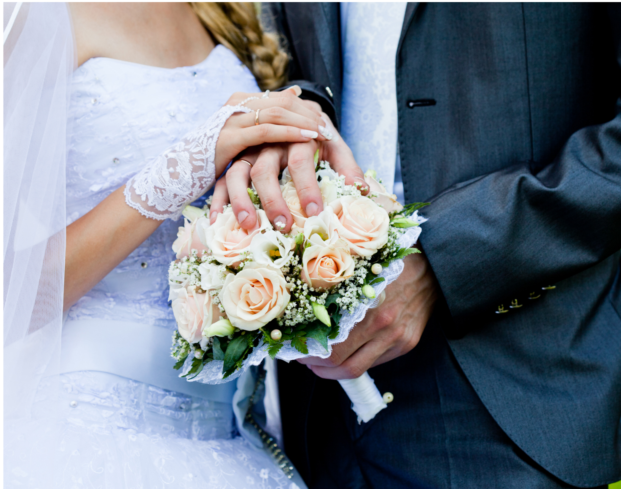
Mange folkekirkepræster har foreslået, at ritualets ordlyd blev ændret til „indtil kærligheden dør“ i stedet for „indtil døden skiller jer ad“

Mange folkekirkepræster har derfor foreslået, at ritualets ordlyd blev ændret til „indtil kærligheden dør“ i stedet for „indtil døden skiller jer ad“. Fordi førstnævnte understreger et moderne ægteskabs vilkår. Og selvom jeg på mange måder er enig i den holdning, så er der noget over ritualets nuværende ordlyd, vi skal bevare, fordi det er den hensigt, vi har, når vi gifter os – nemlig at ville leve sammen i medgang og modgang, indtil døden skiller os ad. Når kærligheden brænder mellem to mennesker, så er det jo dét, vi gerne vil. Og vi vil kæmpe for det – lige så længe kampen giver mening.